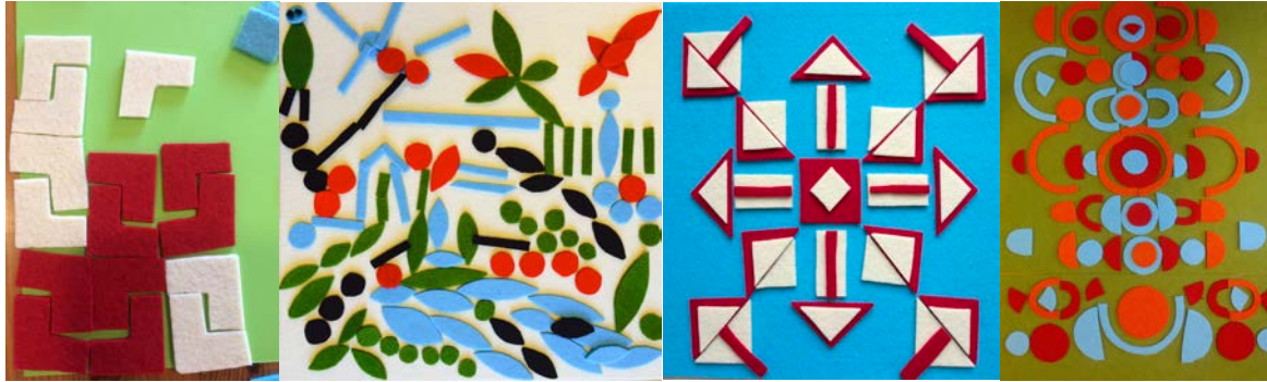
Figur 1. Komposisjoner skapt i Mønster av demente i samarbeid med kunstner og personell.